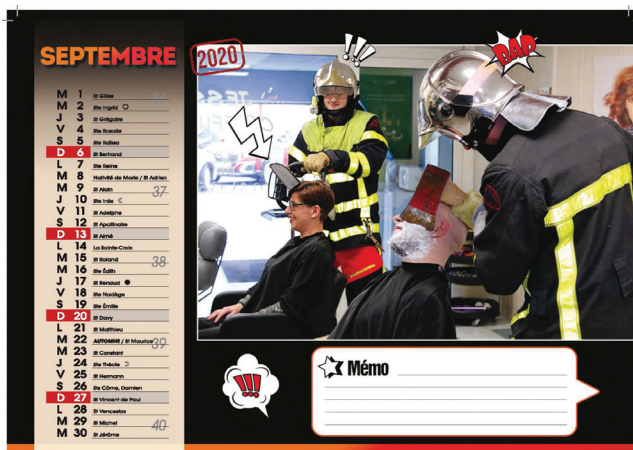
Les pompiers chez les commerçants