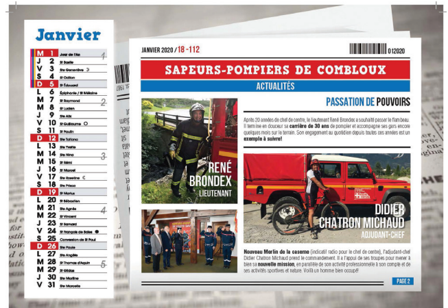
La gazette des pompiers