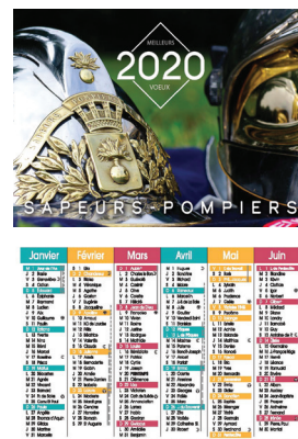
CALENDRIER DE POCHE