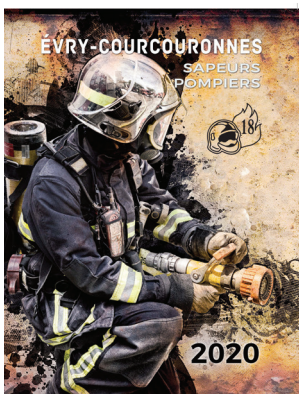
AGENDA PRESTIGE format 20 x 27 cm