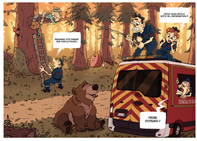
Les pompiers en BD