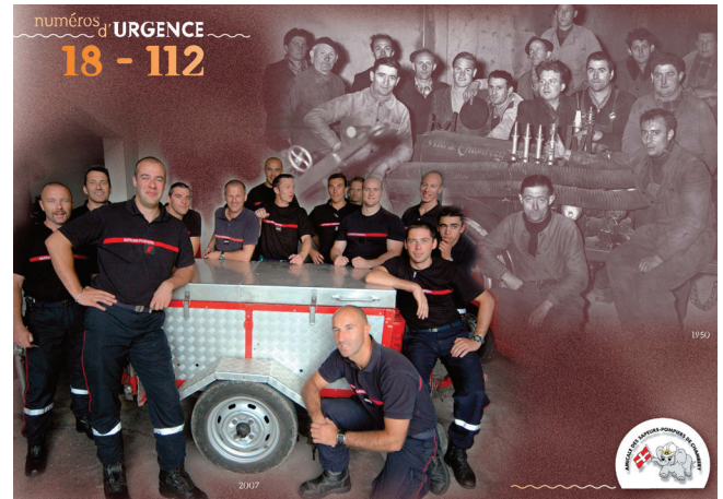
Pompiers d'hier et d'aujourd'hui