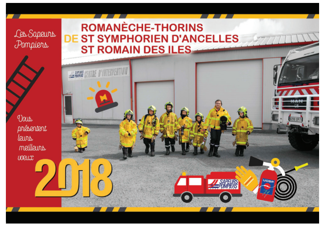
Les enfants prennent d'assaut la caserne