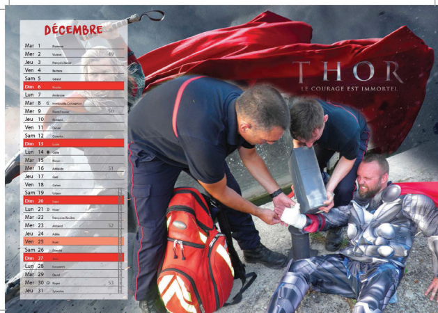
Les pompiers au secours des super-héros