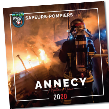
CALENDRIER CARRÉ format 22 x 22 cm