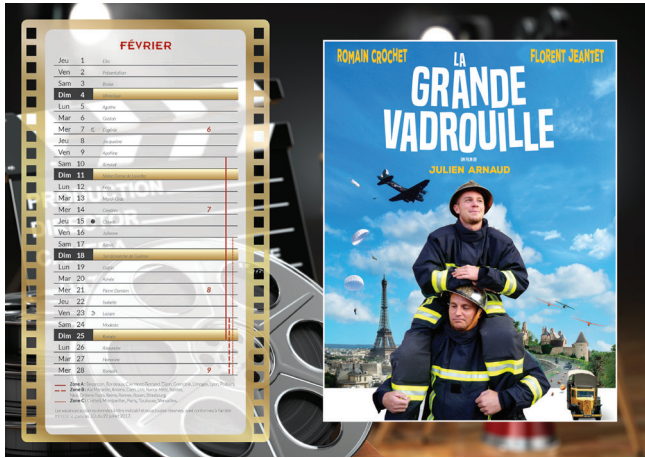
Les pompiers font leur cinéma