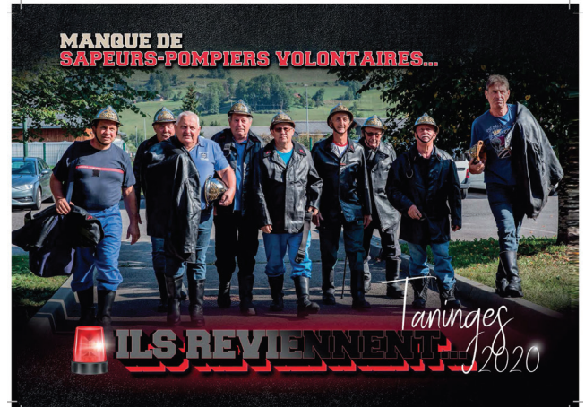
Les anciens reviennent