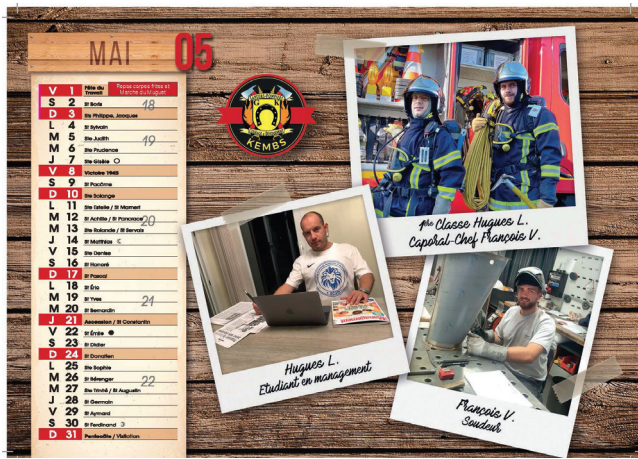
Les pompiers et leurs métiers